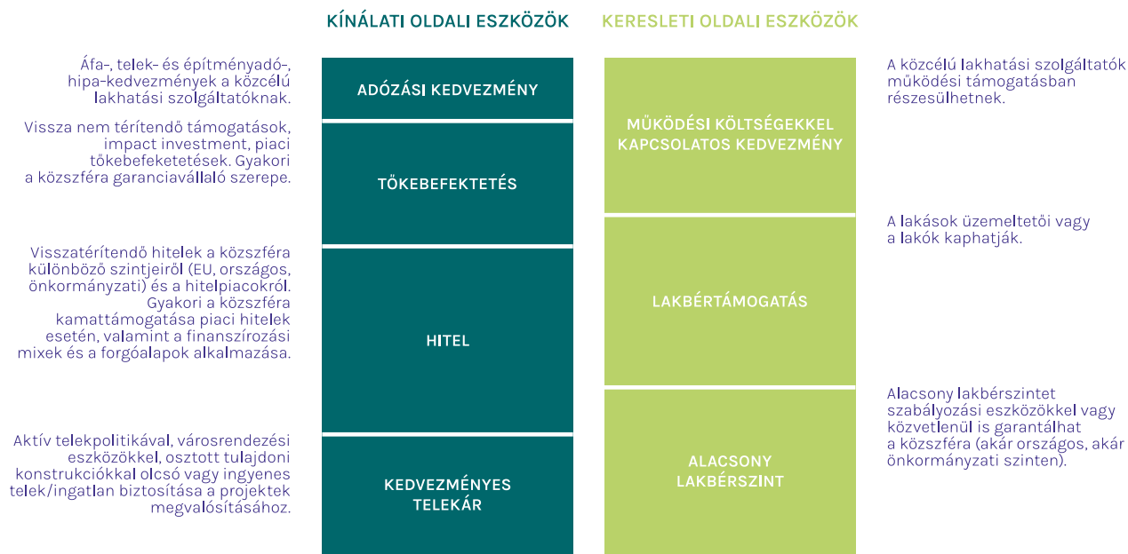
1. ábra - Keresleti és kínálati oldali beavatkozások főbb típusai.

Az AHA projekt Budapestről szól, ami kijelöli, hogy a lehetséges finanszírozási konstrukciók és lakhatási modellek feltárása során mi is olyanokra fókuszálunk, melyek nagyvárosi környezetben valósultak meg. A tanulmányban nemzetközi példákkal foglalkozunk, de ezt olyan keretben tesszük, hogy minél inkább reflektáljunk a Budapesten is lehetséges finanszírozási konstrukciókra; vázolja azt is, hogy bevezetésükhöz mire lenne szükség, ha ma még nem léteznek.