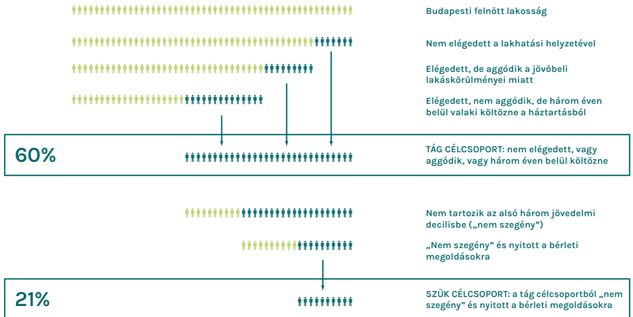
2. ábra - A megfizethető bérlakásszektor célcsoportjai Budapesten. Forrás: Jelinek, Czirfusz 2023

A tág célcsoporton belül a jelenlegi piaci bérleti díjakat a döntő többség túl drágának találta, viszont egy jelentős csoport akár hosszú távon is jó megoldásnak tartaná a lakhatási problémáira a megfizethető bérlakásokat (3. ábra). A jelenlegi lakhatási helyzetükkel tipikusan a bérlők és a fiatalok elégedetlenek, és ők a legnyitottabbak arra, hogy hosszú távon is megfizethető bérlakásban éljenek.